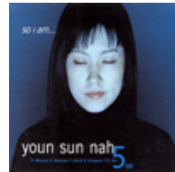
<So I am...>, 2004