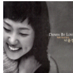
<Down by love>, 2003